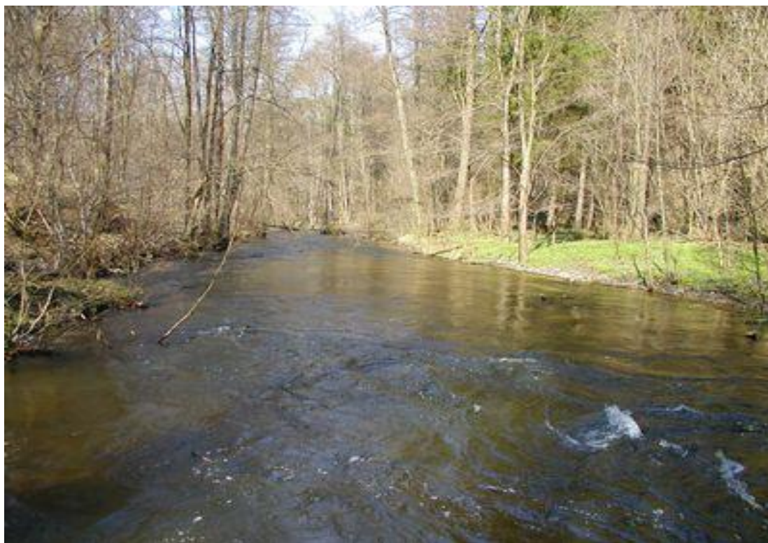
Fot. 2. Rzeka Wel