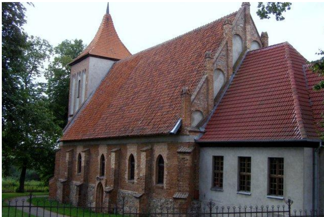
Fot. 5. Kościół p.w. Św. Jana Chrzciciela Narzymiu