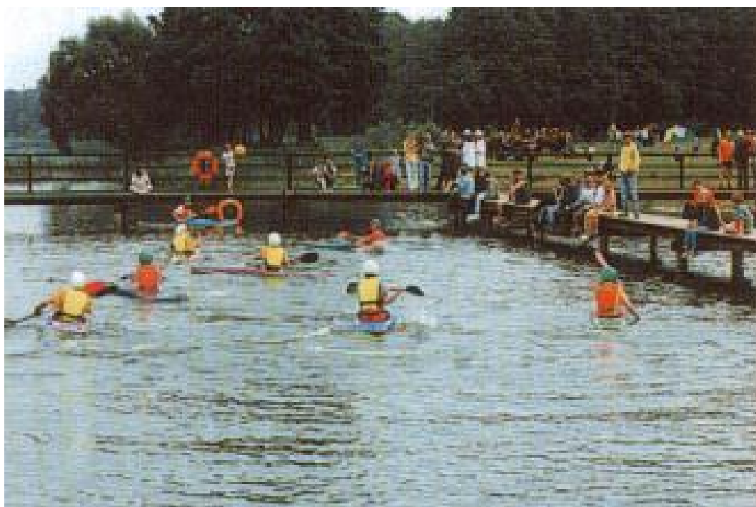
Fot. 4. Jezioro Lidzbarskie