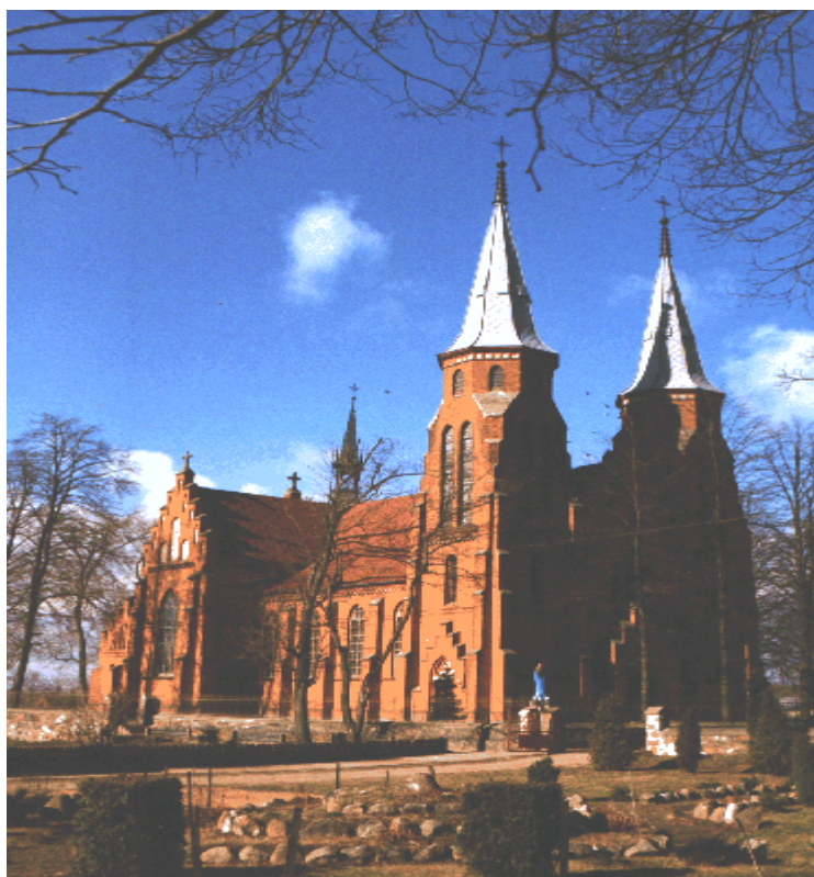
Fot. 6. Kościół parafialny w Janowcu Kościelnym