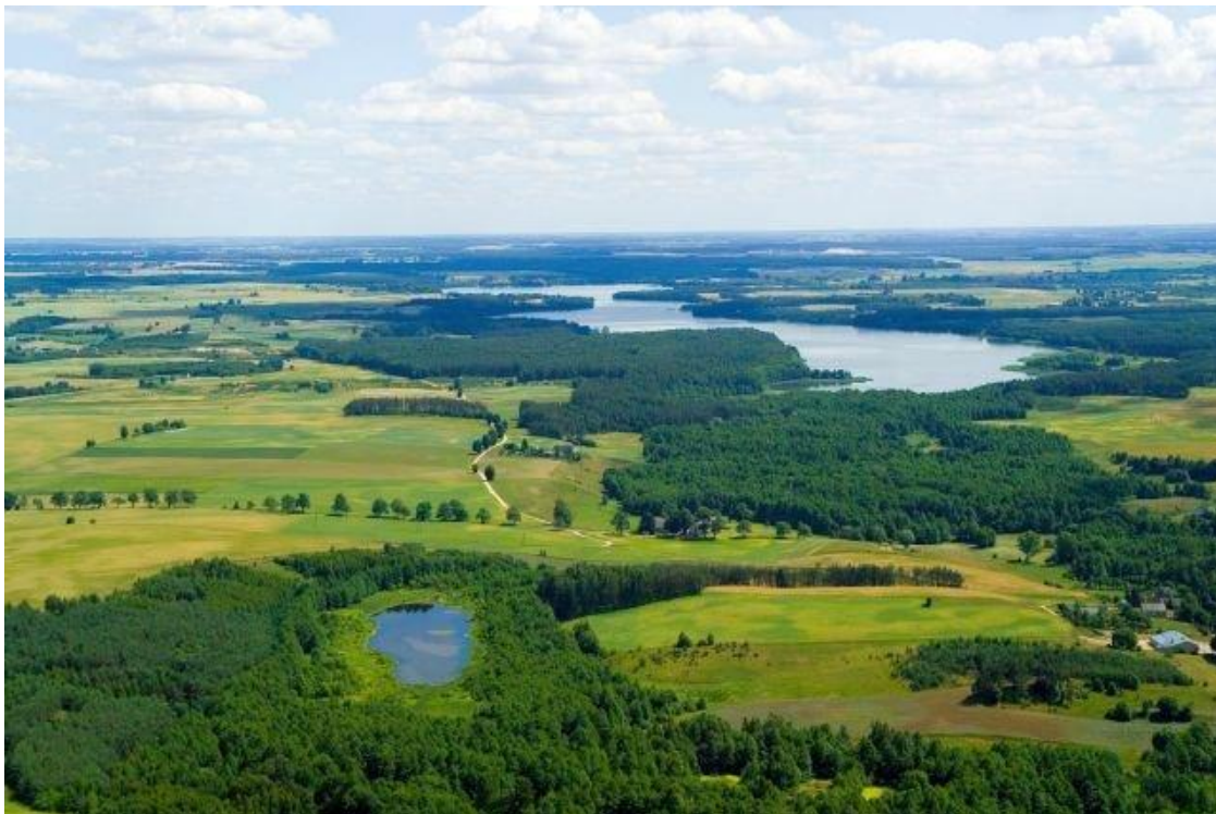
Fot. 1. Gmina Rybno z lotu ptaka